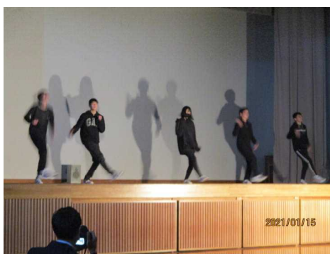
< 8年生 >