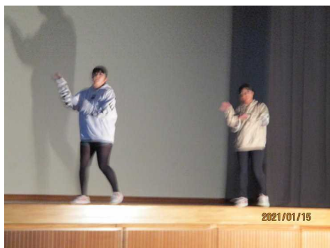
< 9年生 >