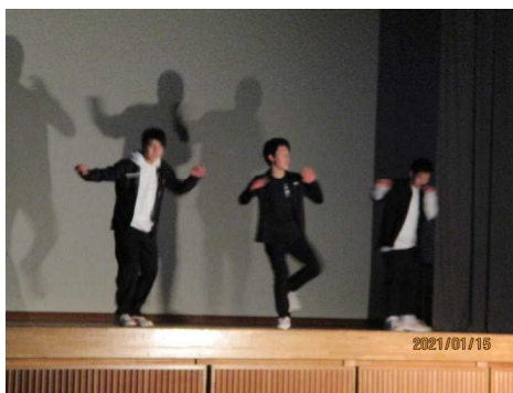
< 9年生 >