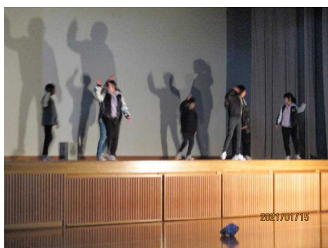
< 7年生 >