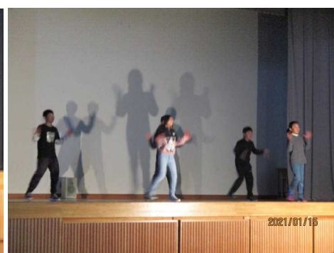
< 5・6年生 >