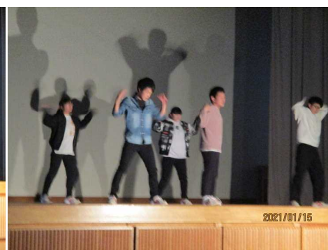
< 9年生 >