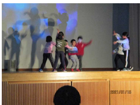
< 1・2年生 >

昨年度までは中学校の参観日で行われていましたが、今年度は前期課程も加わり、1年生から9年生がステージ発表を行いました。どの学年も二学期から取り組んできた練習の成果が十分に発揮されて、どの学年も素晴らしい発表になりました。