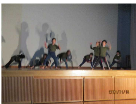
< 3・4年生 >