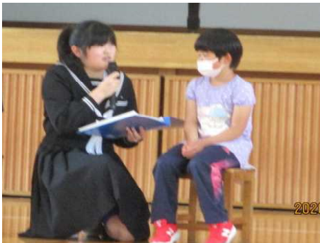
<1年生ヘインタビュー>

1年生と後期課程のみなさんが日常的に仲良くしている様子はいつも微笑ましく、お互いにエネルギーをもらっているように見えます。今後も朝行事などで全校で仲良く遊ぶ機会を大切にしたいです。