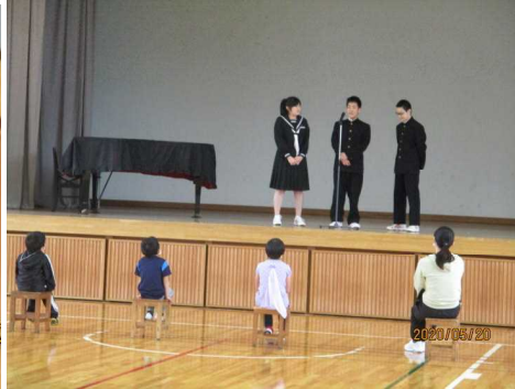
<漫才による学校の紹介>