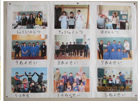
<全校からのプレゼント>